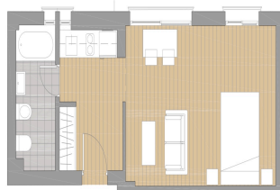
PLANO | ESTUDIO