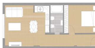
PLANO | 1 DORMITORIO