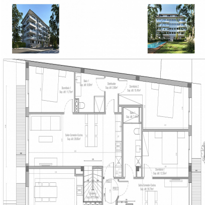
4 th DUPLEX